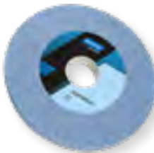
SGA / SGB