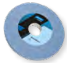
3SG / 5SG